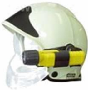
přilba GALLET F1 SA svítilna UK 4 AA