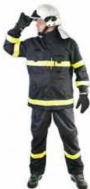
zásahový komplet BushFire