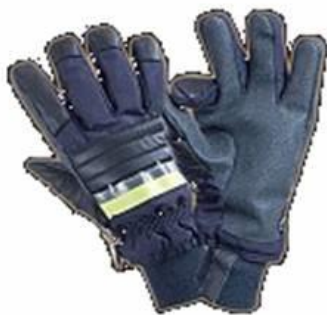
zásahové rukavice SALAMANDER