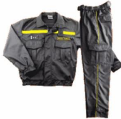
pracovní stejnokroj PS-II - bavlna